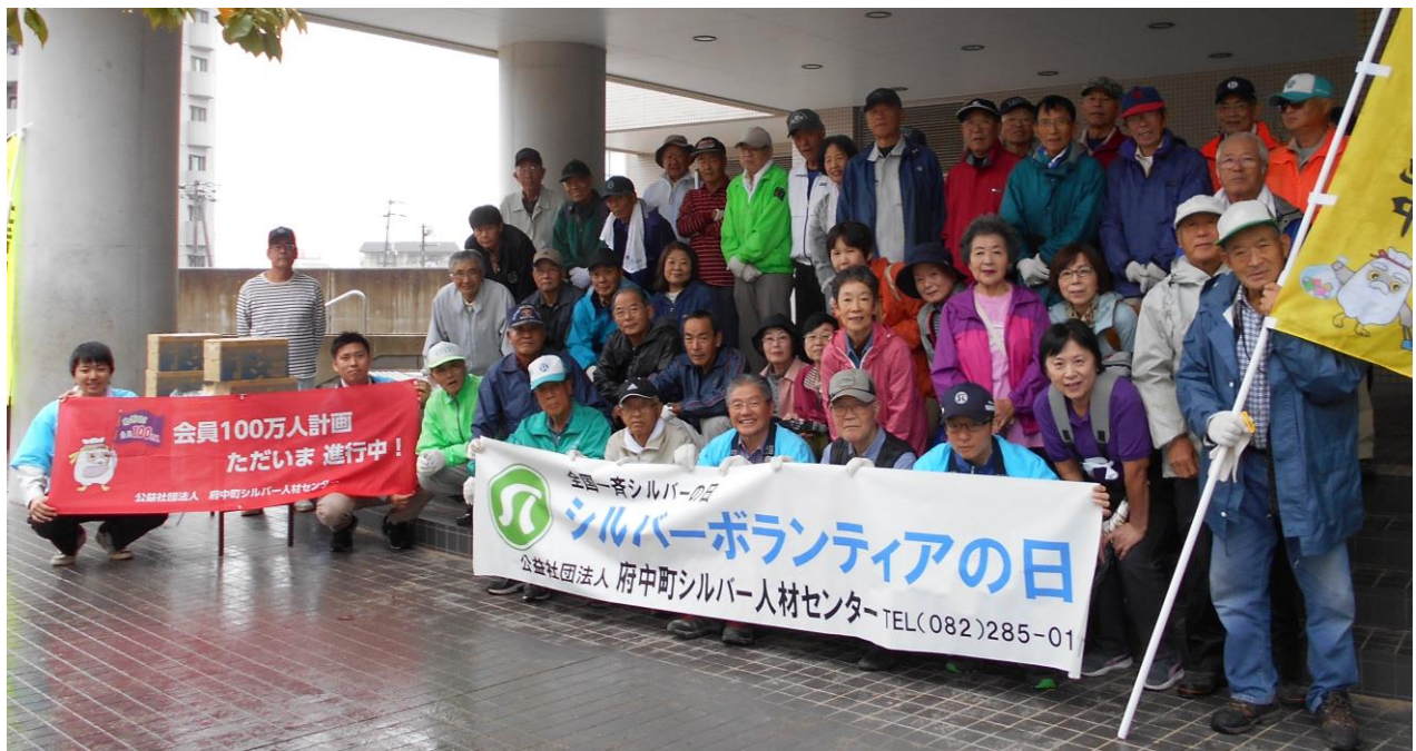
<令和元年度 清掃ボランティア集合写真>