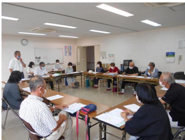
＜令和2年度第3回理事会の様子＞