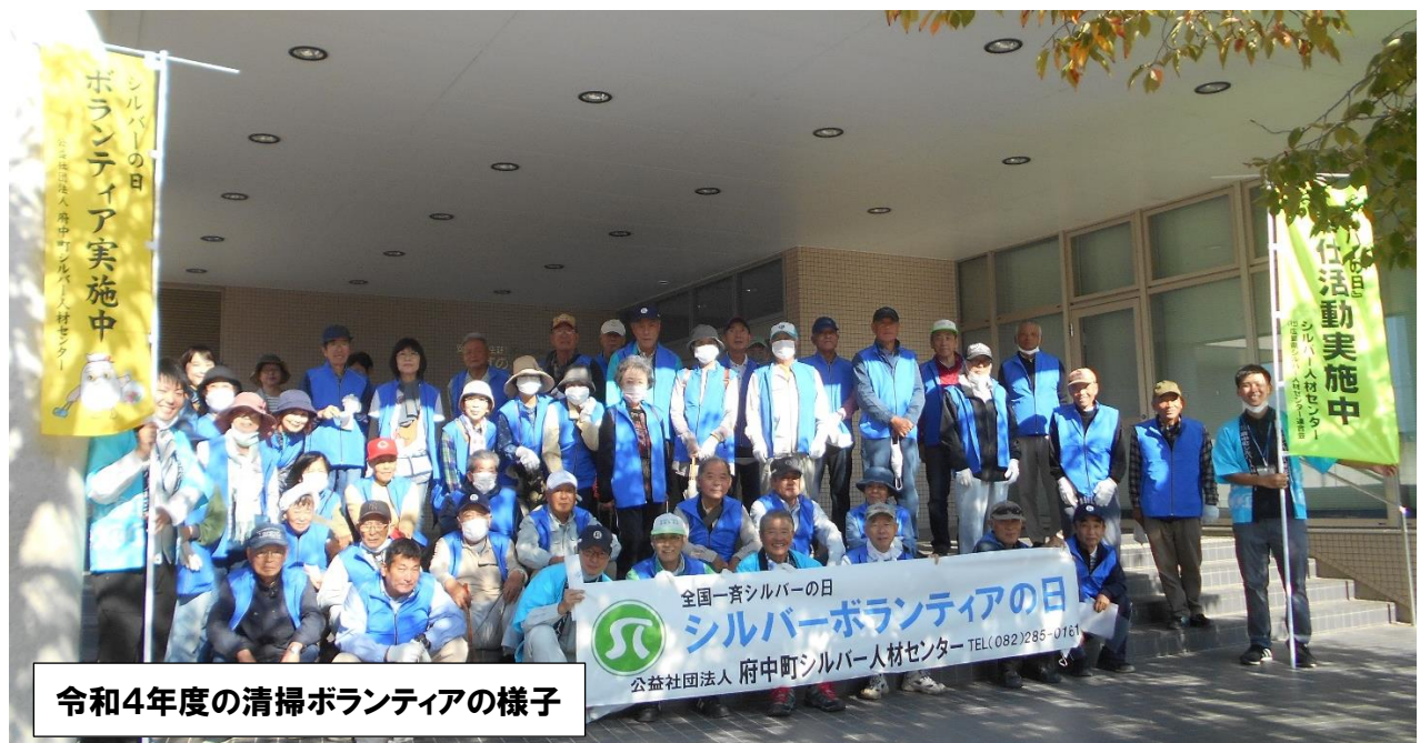
令和4年度の清掃ボランティアの様子