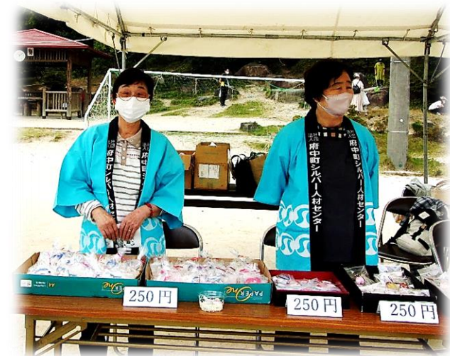
<令和4年度の出店の様子>

令和5年10月21日(土) 10時～16時予定 (お祭りは10時～20時まで開催しています。)