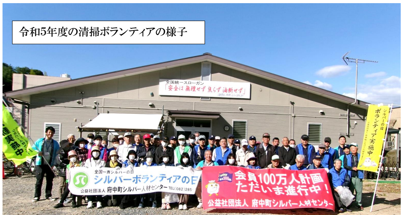
令和5年度の清掃ボランティアの様子